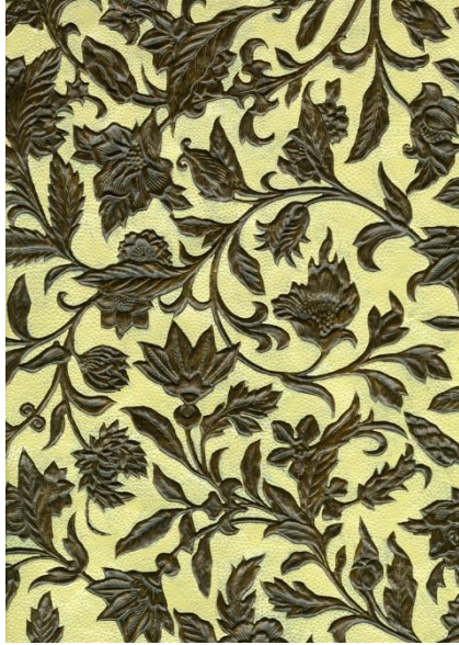
画像 1 鹿鳴館壁紙復原金唐革紙