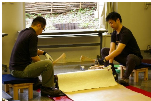
画像 3 金唐紙製作実演会風景