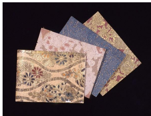
画像 4 金唐革紙切見本