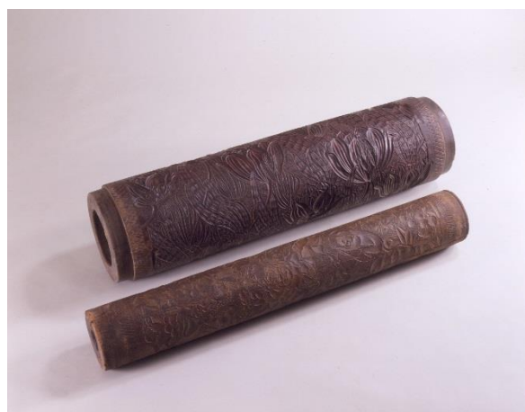
画像 5 金唐革紙用版木ロール