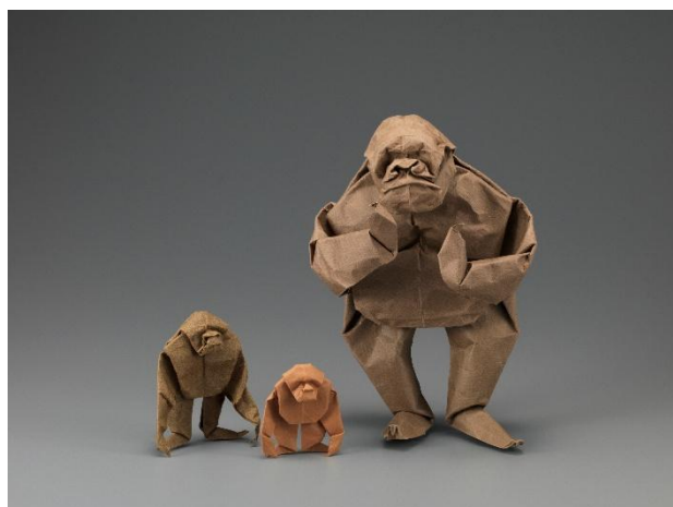
2. 吉澤章創作折り紙「ゴリラ」