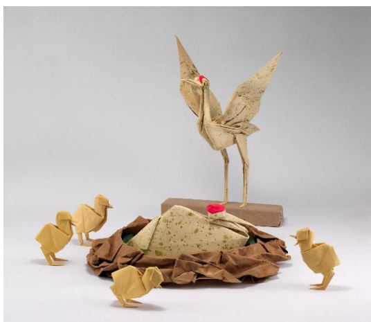
1. 吉澤章創作折り紙「鶴の巣籠り」