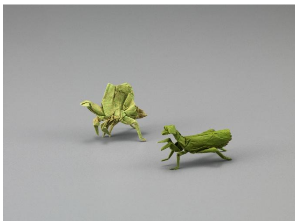
3. 吉澤章創作折り紙「カマキリ」