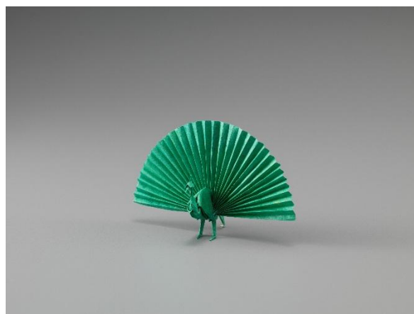
4. 吉澤章創作折り紙「クジャク」