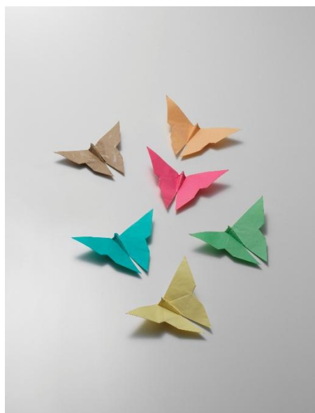
5. 吉澤章創作折り紙「チョウ」